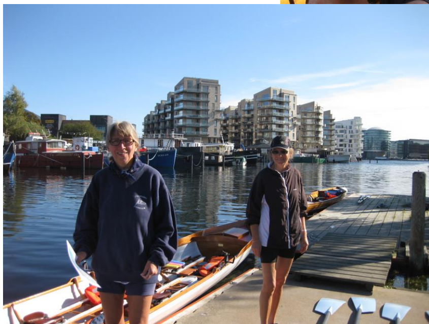
Fra Rotur i København i 2010.