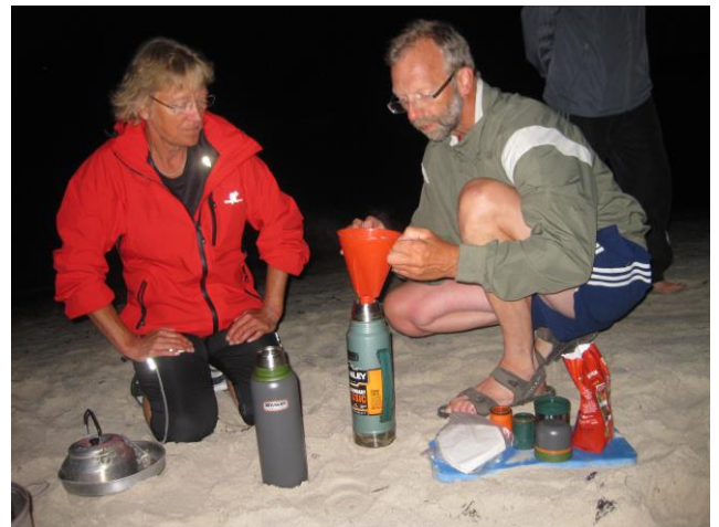
Kaffebrygning på stranden – Fra en uforglemmelige rotur rundt om Bornholm